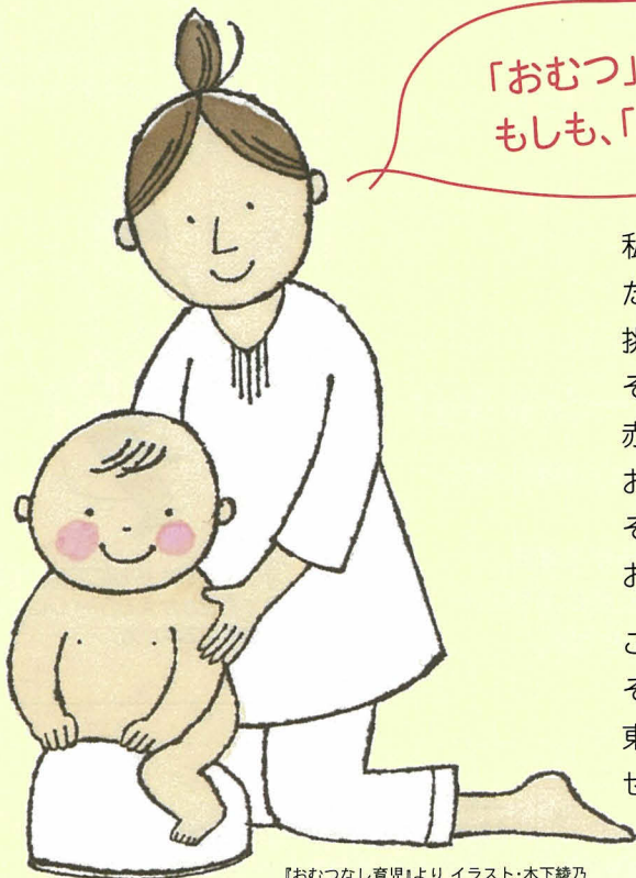
『おむつなし育児』より イラスト・木下綾乃

「おむつ」って、いつも、ぜったいに必要なものかな？ もしも、「おむつ」がなくても過ごせるとしたら？