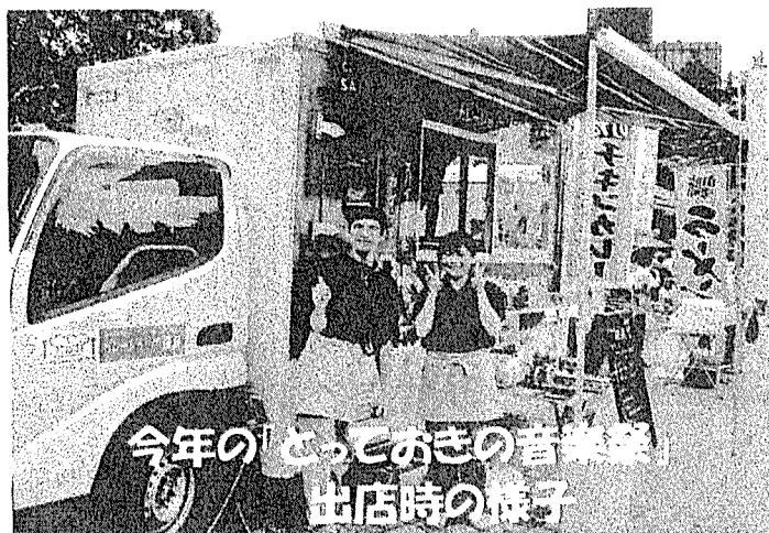
今年の「とっておきの音楽祭」 出店時の様子