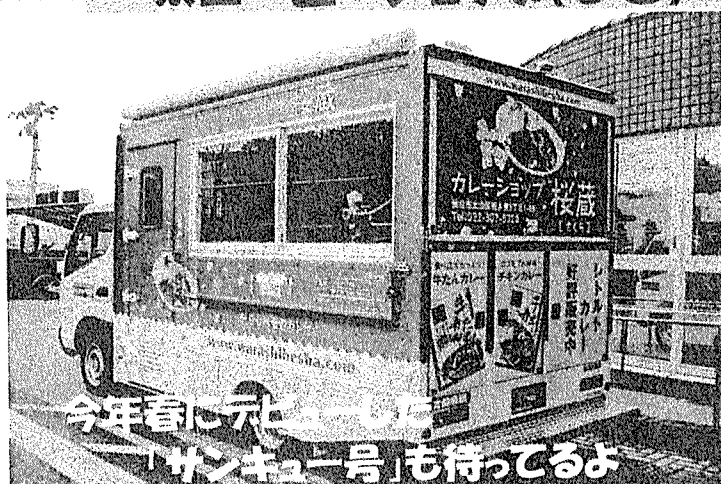
今年春にリニューアルした 「サンキュー号」も待ってるよ