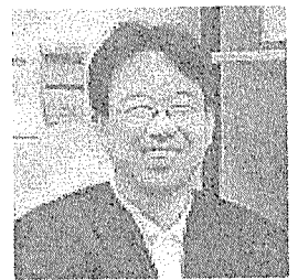
講師 東北大学大学院教授