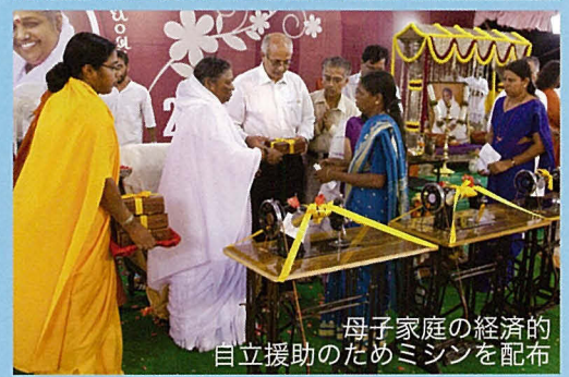
母子家庭の経済的自立援助のためミシンを配布