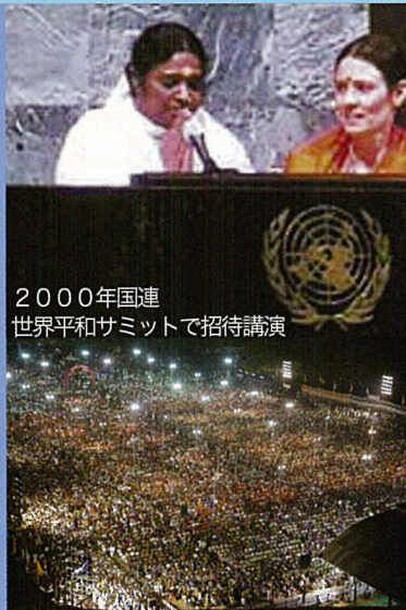
2000年国連 世界平和サミットで招待講演