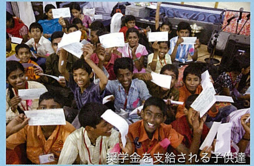
奨学金を支給される子供達