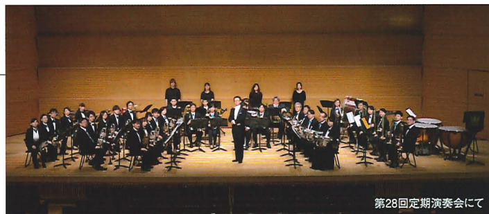
第28回定期演奏会にて

ブラスバンドのサウンドを聴衆の皆様と共に味わい、楽しむために、日夜練習に励んでいる。