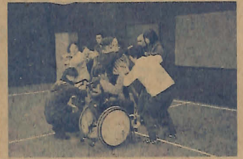
11月のワークショップの様子