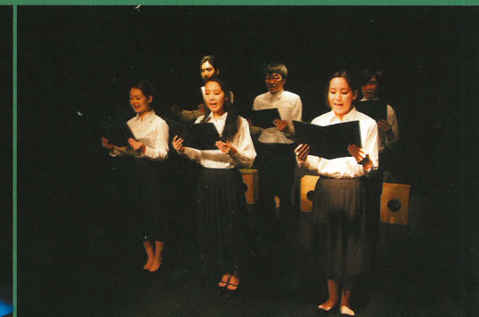
「イーハトーヴの雪*組曲」