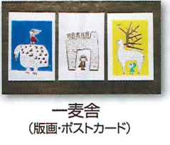
一麦舎 (版画・ポストカード)