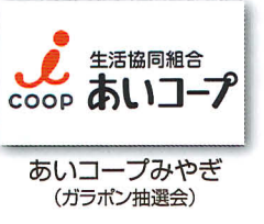
あいコープみやぎ (ガラボン抽選会)