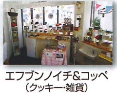
エフブンノイチ&コッペ (クッキー・雑貨)