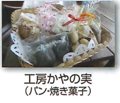
工房かやの実 (パン・焼き菓子)