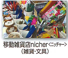
移動雑貨店nicher<ニッチャ> (雑貨・文具)