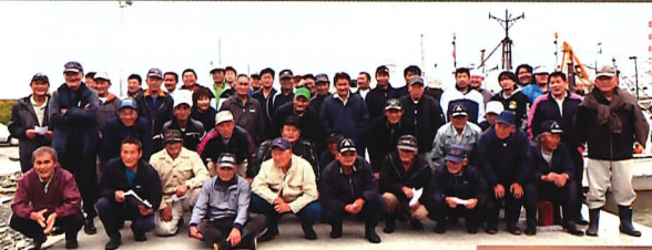
映画「新地町の漁師たち」

この夏、女川の豊かな自然・文化の紹介をしつつ、たくさんの人に女川をもっともっと好きになってもらう交流の場をつくりたい。みんなで未来をひらく夏の文化祭です。ぜひあなたもご参加ください。