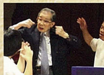
日野原 重明さん 聖路加国際病院 理事長

私は大阪で、 音楽に癒されたダウン症や 自閉症の青年たちが 愛のミュージカルを演じる ステージに招かれ 共に歌い、踊りました。 あの時の感動を 忘れることができません。