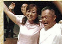
竹下 景子さん 俳優

あぶあぶあには ゆつたりとした時間が流れている。 前向きで優しく、 しかも確かな時の連なり。 始まりは小さな一歩。 今私の中に 限りなく大きな歩を 与えてくれた。 愛と勇気と喜びと、 そして信じる心をありがとう。