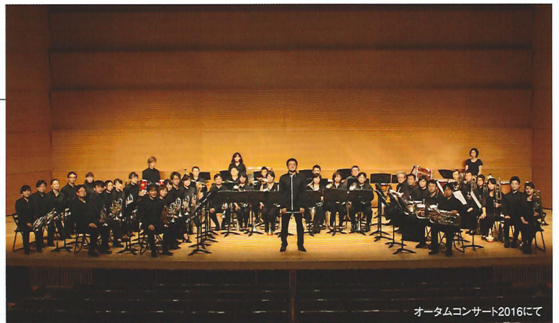
オータムコンサート2016にて

ブラスバンドのサウンドを聴衆の皆様と共に味わい、楽しむために、日夜練習に励んでいる。