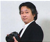
庄子 隆 フォトグラファー