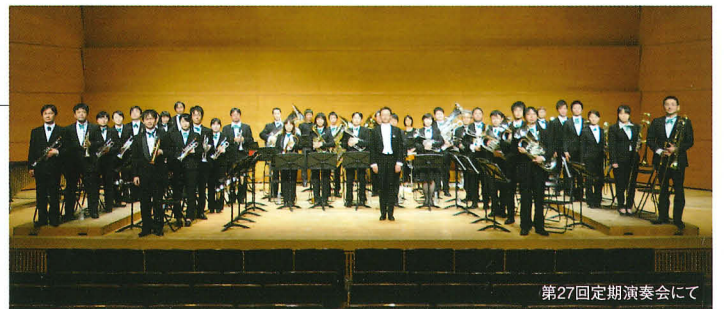
第27回定期演奏会にて

ブラスバンドのサウンドを聴衆の皆様と共に味わい、楽しむために、日夜練習に励んでいる。