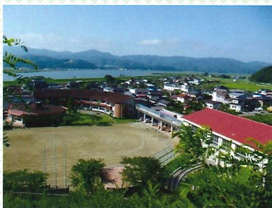
震災前の石巻市立大川小学校