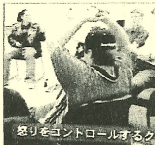
怒りをコントロールするク