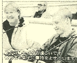
裁判長にほめられ思わず ニコリの親子