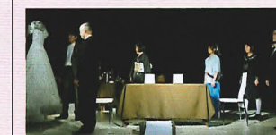
「White-あの日、白い雪が舞った-」

被災地の演劇人として後世に伝える作品 を作り、演劇による震災からの「心の復興」 を思い活動しています。 作品は被災地で生きる私達の「想い」で あり「願い」であり「祈り」。震災後を生きて る人々の、家族を失った悲しみを乗り越え ていく姿を描き出します。