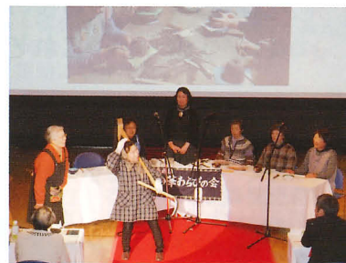
第3回いがす大賞発表の様子

第4回目の開催となる今回は、どのような発表が飛び出すのでしょうか!? 熱いパフォーマンス、心温まる活動紹介をぜひ会場で! 生で感じてください!