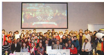
第2回いがす大賞授賞式