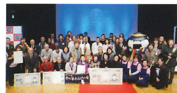
第3回いがす大賞授賞式