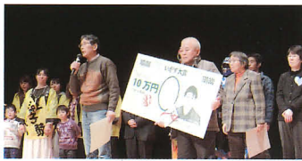
第1回いがす大賞授賞式