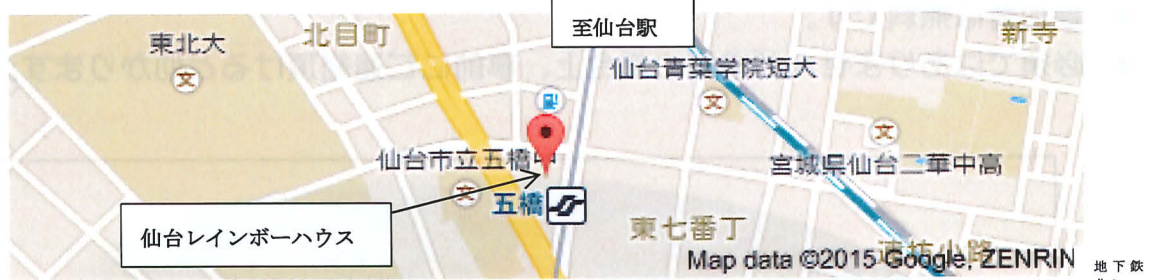
「仙台レインボーハウス」の詳細地図