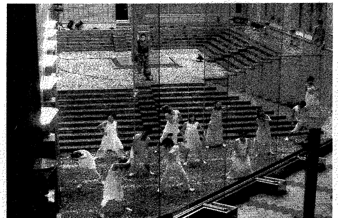
三角フラスコ#29「昼の花火、夜の花火」(2008年7月) 【仙台市青年文化センター 中庭】