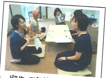
どうやって気持ちを伝える？