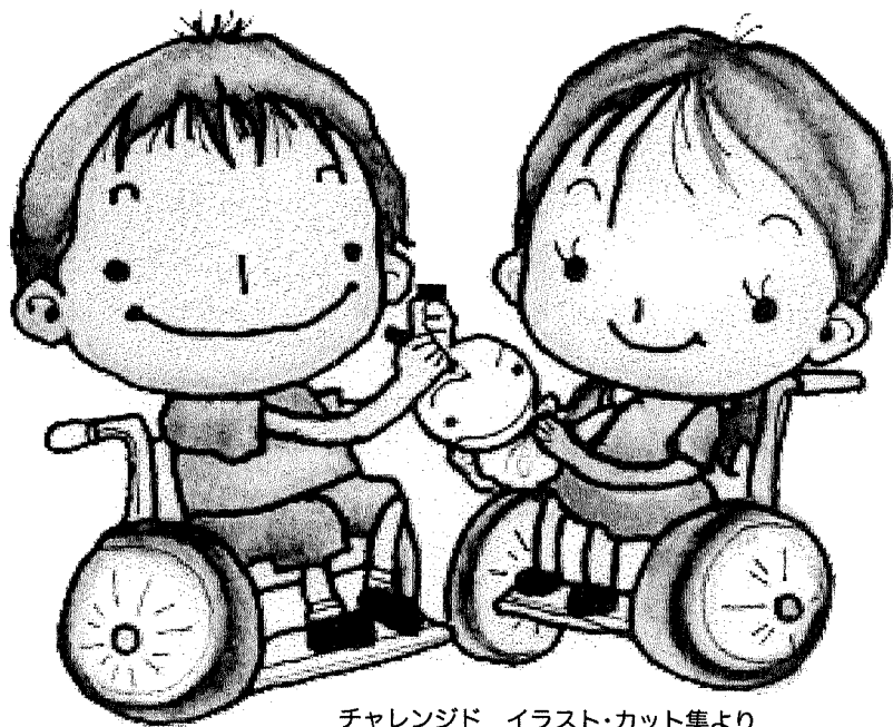
チャレンジド イラスト・カット集より

コース (予定) / 勾当台公園グリーンハウス前広場 → 一番町アーケード ⇒ 仙台駅前 仙都会館前解散