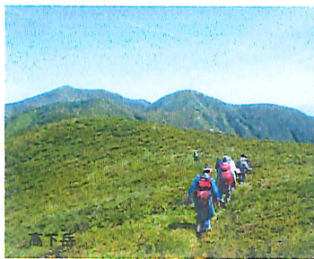
月山より鳥海山を望む