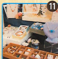
Atelier Smile DAiYA 天然石アクセサリー(シルクコードネックレス、プレスレッド、イヤリングなど)