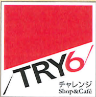
4月29日(全・夜)にグランドオープン! 光が射し込む露風店で新たなスタートを切ったショップオーナー達のこだわり商品を見に是非お越しください。