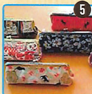
ソーイングカフェ coton 布小物(かま口・ポーチなど)、アクセサリー、消しゴムはんこ