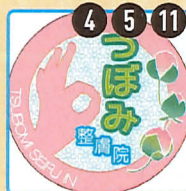
つぼみ整骨院 皮膚を癒しくつまんではなすリラクゼーション(目、肩、腕、背中等)