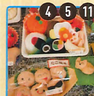
私の手作り フェルト雑貨(お子さんが喜ぶ食べ物が詰まったお弁当、袋、動物など)