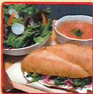
旬菜 ミミとリのお野菜cafe 野菜ソムリエの店主が選んだ旬の食材でつくる季節感あふれるサントイッチプレートなど