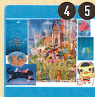
アトリエ KAORI ファンタジー絵画と雑貨 & 新仙台みやげ・びーこけ