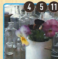
暮らしの古道具 おのや 文徳元年(1501年)515年前に山寺で創業した古道具屋