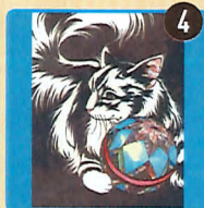
駒屋 切り絵、ペンダント