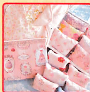
布ナフキン専門店 ジュランジェ 可愛いデザインも豊富に取り揃えた布ナフキンで女性のHappyを応援します