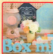
Box mioko 小さなお子様から大人のお客様まで楽しめる木工雑貨やレジンアクセサリー