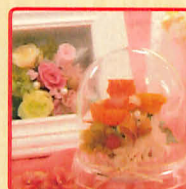
華陽 angel 花の色彩や配色を考え、卓上や壁掛けなど種類豊富なアクリラート&シルクフラワー