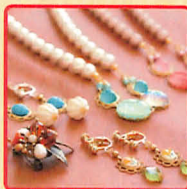
retro jewelry EMMA ウィンテージ感やレトロテイストのパーツを使用したハンドメイドジュエリー