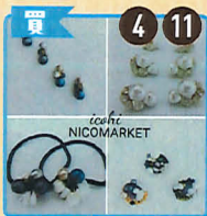
NICO MARKET ハンドメイドアクセサリー、布小物

仙台市ガス局ショールーム ガスサロン 中庭でTRY6のOBや復興グッズの作り手さんによる販売会を行います。開放的な中庭で、目当ての春アイテムを見つけよう。丸数字は各出店日です。お目当てのショップをチェックしてね。