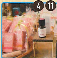
アンブルール アロマオイル(春のおすすも)、ハーブティー数種、気仙沼の醤油