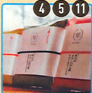
地球の恵 無添加石けん(馬油・米ぬか・あかもく、いちご・わかめなど)