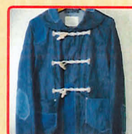
イシー商店 アウター・トップス・パンツなどをほぼ一点モノで手づくりする洋服のお店

2016年 6月4日(土)・5日(日) & 11日(土) 11:00~16:00 11:00~15:00 9:30~16:00