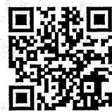
東北エリア会場案内

NA は薬物が深刻な問題となった者たちの非営利的な集まり、いわゆる会である。私たちは回復の道を歩むアディクト (依存症者) であり、定期的集まってお互いがクリーンでいられるよう手助けし合っている。このプログラムはあらゆる薬物から完全に離れるというものだ。ぜひあなたにも、心を開き、ここでチャンスをつかんでいただきたい。