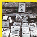
on green book street