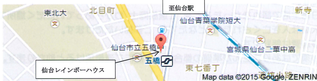
「仙台レインボーハウス」の詳細地図