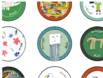
Ai ファクトリー 「オリジナル缶バッチ作りワークショップ」