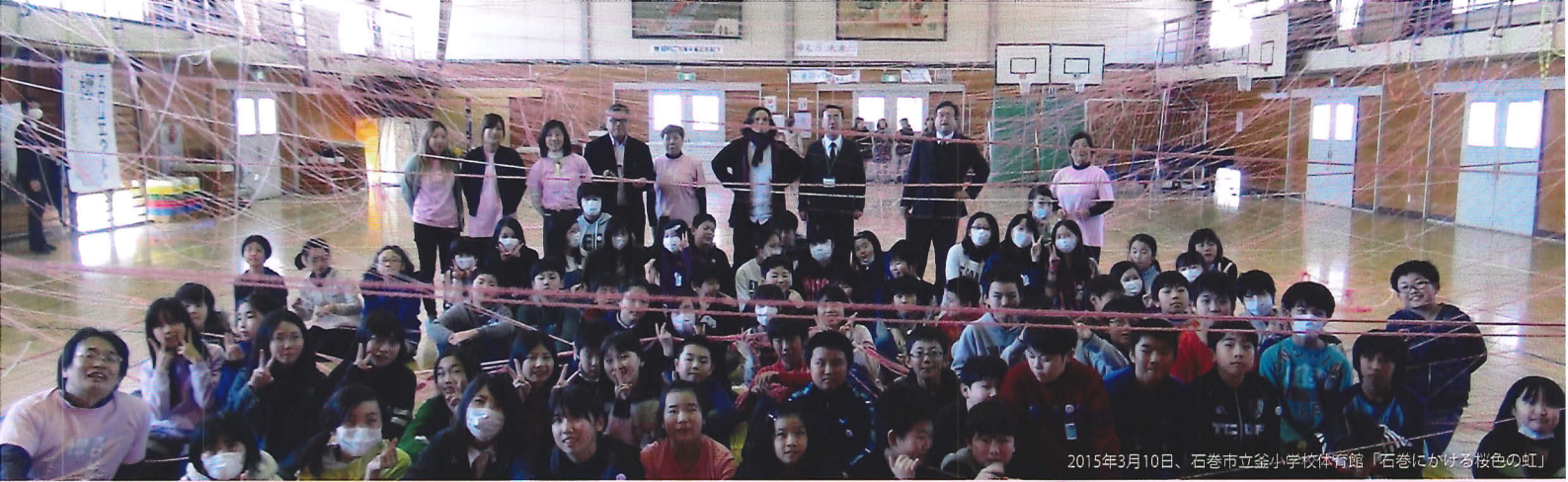
2015年3月10日、石巻市立釜小学校体育館「石巻にかける桜色の虹」