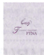
指導者パスポート