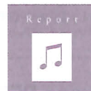
ingプログラム Reportシール