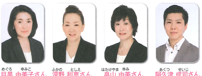
美容部のみなさん

1999年ハーバー研究所に入社。 美容業界歴37年の経験と豊富な知識を 生かし、全国各地で美容セミナーを 開催。NHKカルチャーや市民大学の 講師も務める。近年、障害を持つ方 のメイクサービスにも取り組む。 著書に『大人美スタイル』(NHK出版)、 『お手入れの「本当」美肌本』(NHK出版) がある。