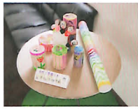
やまのものアート展【ホッコリ展】