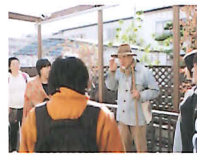
いしのまきのアート展【ワークショップ】