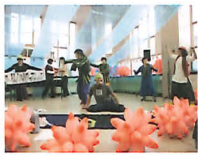
いしのまきのアート展【オープニングライブ】