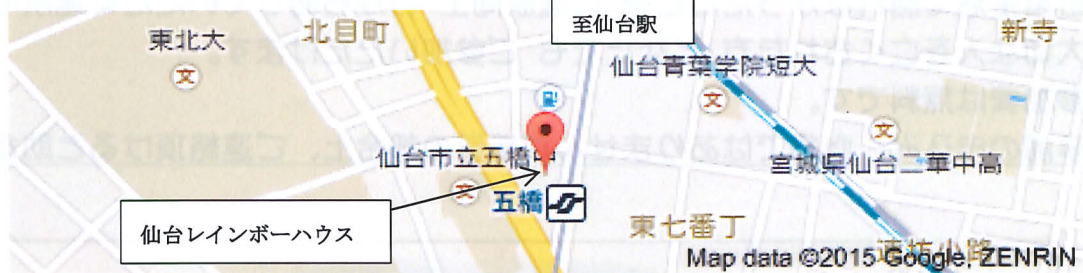
「仙台レインボーハウス」の詳細地図