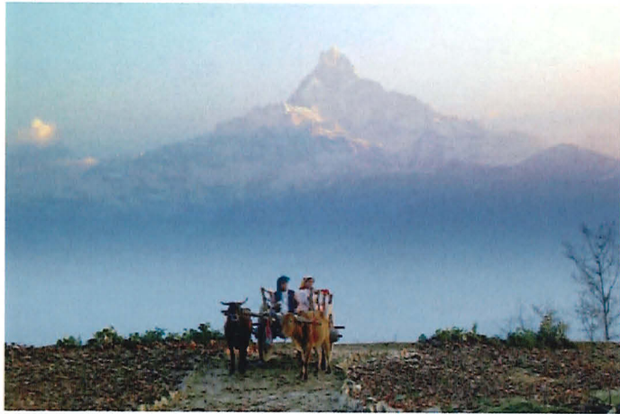
映画「カタプタリ」から / (c) 伊藤敏朗,2008.