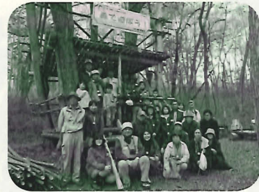
ツリーハウスの前で集合写真

※予めご了承ください※ 本活動を広報する目的で活動の様子を撮影させていただきます。写真は当団体の Web-Site および情報紙に掲載する予定です。 ご理解とご協力をお願いいたします。ご都合の悪い方は事前にご相談下さい。