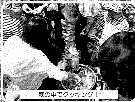
森の中でクッキング！