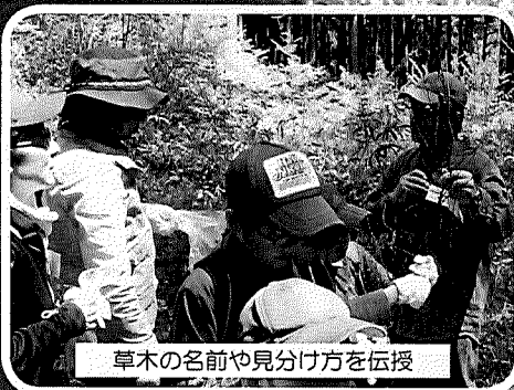
草木の名前や見分け方を伝授

見て、触って、味わって 森林の中で遊び 自然に触れ合いながら 里山の大切さを 考えてみませんか？