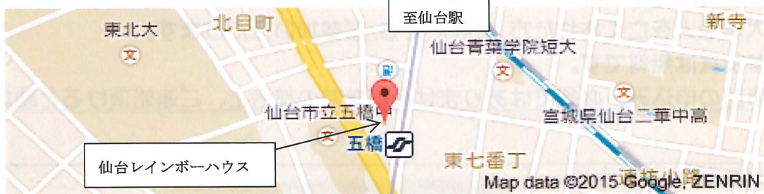
「仙台レインボーハウス」の詳細地図