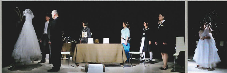
※ Whiteプロジェクトは、上演機会を募集しています、あなたの町で上演します。

■あらすじ 「どれだけの花嫁衣装が袖を通されなかったらう……」 物語の舞台は震災から三年後の春。宮城県の某町の結婚式場親族控室。ある奇妙な結婚式が行われようとしていた。津波に流されて、未だ行方不明の娘その娘のために「異界婚」を山形の若松寺で執り行った両親が「悪い出話を親しい人達です」という形の結婚式を企画する。式直前の親族控室。集まった娘の元婚約者・友人・親戚が彼女の思い出を語る。震災後を生きる人々、家族を失った悲しみを乗り越えていく姿を描き出す