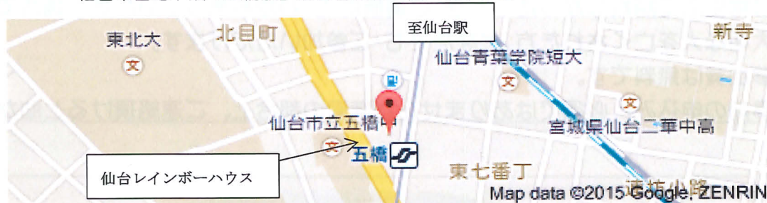
「仙台レインボーハウス」の詳細地図