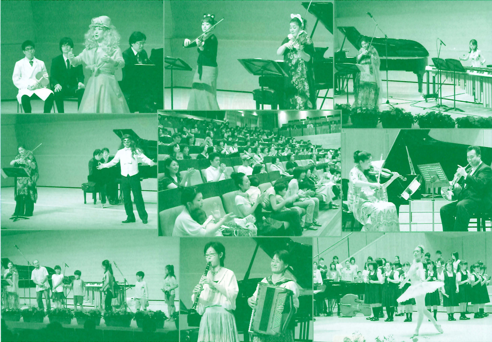
これまでのコンサート風景