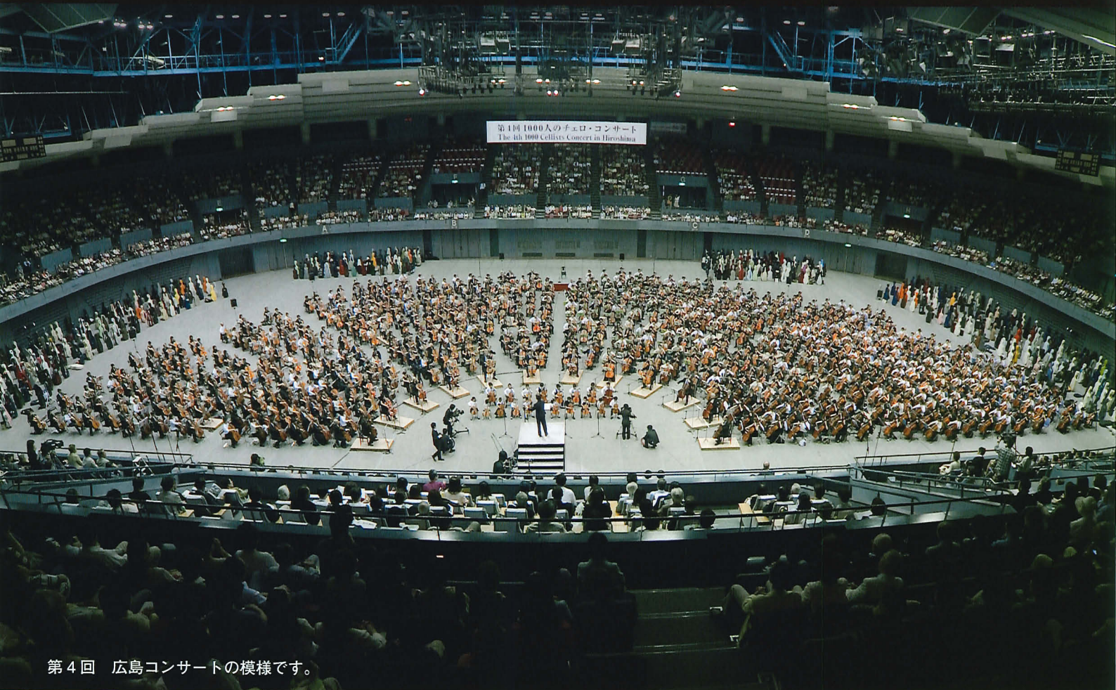
第4回 広島コンサートの模様です。

2015年5月24日(日) 14:00開演 [13:00開場] ゼビオアリーナ仙台