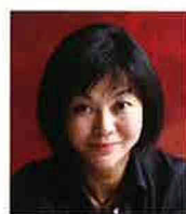
フォトグラファー 福田沙織さん

履歴書の写真は第一印象を決める要素です。 写真の大切さと就活用のヘアメイクを学ぼう！