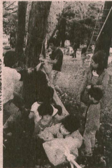
ハンモックで遊ぶ子どもたち

週末中だった。放課後、場所によっては平日も3日間 に亘り子どもたちが楽しめる。週末に加えて平日も3日間 運来中だった。放課後、場所によっては平日も3日間