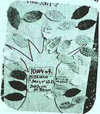
「お祝いのメッセージもたくさん!」