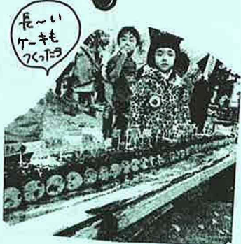
「毛いーキもつくろ」