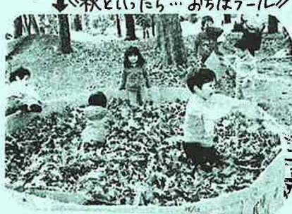
「秋といたら... おちばグループ」

西公園フレーザーパーク10周年、とてもいい雰囲気の中でお祝いできてうれしかったです。フレーザーパークだけでなく、周りにいる大人やお母さんたちの力を合わせて2日間やりきれたこと、すごいです。