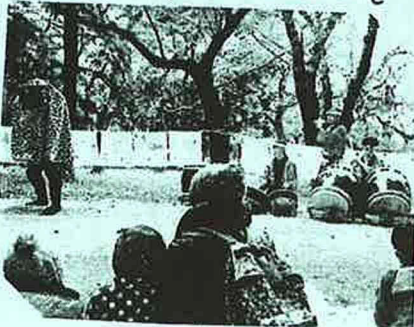
「お祝いに、たいていしまいも」