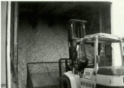
工場見学（間伐材のペレット加工施設など）