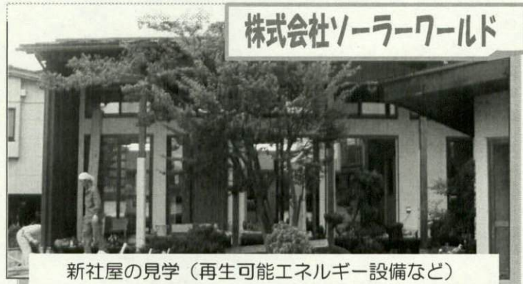
新社屋の見学（再生可能エネルギー設備など）