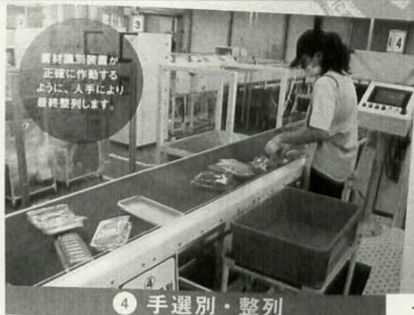
素材識別装置が 正確に作動する ように、人手により 最終整理します。