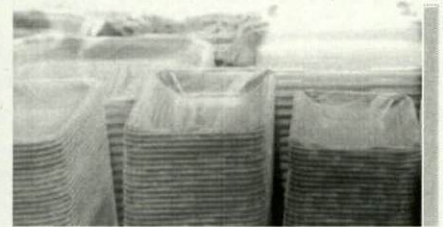
工場見学（トレーの選別回収施設など）

近年企業の環境への取組みは活発になってきています。 山形のリサイクル・再生可能エネルギーを積極的に 取り組んでいる企業・団体施設を見学します。 見学を通して、さらに環境知識を深めませんか？