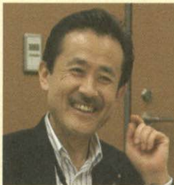
エネ経会議代表理事