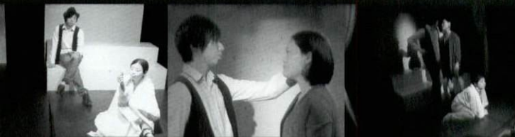
みちるCafé公演 Vol.1 2013年3月「Nowhere」クォータースタジオ

アクセス▶ クォータースタジオ 仙台市青葉区五橋2-9-10 アラキビルB1F 東北学院大学土樋キャンパス南東隣 「お好み焼き 田よし」地下 地下鉄五橋駅南口徒歩5分 アラキビルと東北学院大学の間の通路から地下に降ります スタジオ携帯電話090-7522-1414