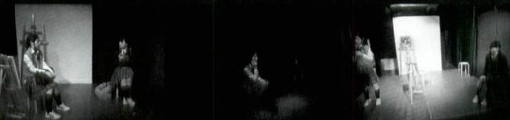
みちるCafé公演 Vol.2 2013年12月「Over The Flowers」クォータースタジオ 2014年 2月「Over The Flowers」JYS賞授賞式招待公演 仙台文学館