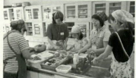
過去の講座の様子※会場は別の場所です。