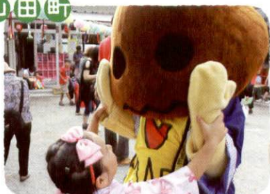
私たちが考えた「まつい」が山田町内外で活躍中!