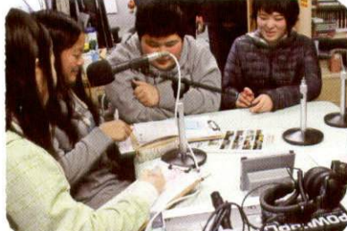
陸前高田災害FMでぼくら、子どもの思いや意見を発信!