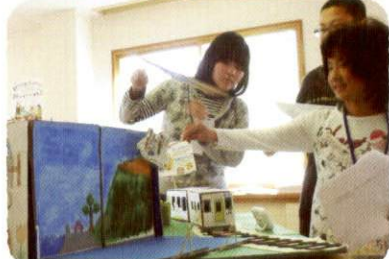
町の運める復興整備計画へ、子どもたちのアイデアを提案!