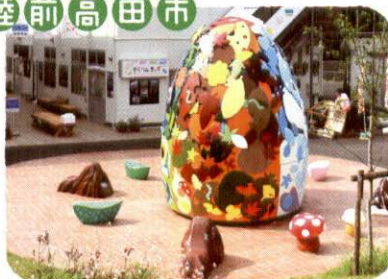
ミニ「あかりの木」、JIA ゴールデンキューブ賞特別賞受賞!