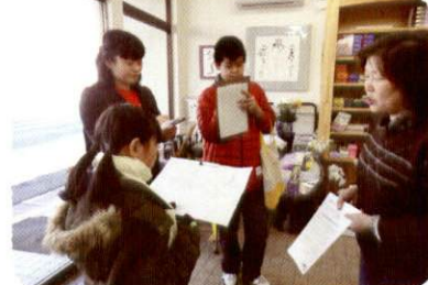
商店街の活性化に向け、マップづくり展開中!