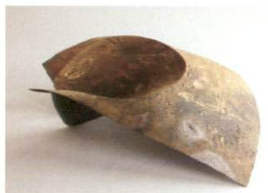
『丘』 W90 cm