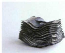
『積層フタモノ』 W30 cm