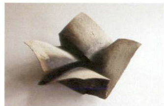
『折』 W45 cm

本展は、泉田之也にとって初の大規模個展として開催されます。今回初めて現代美術のジャンルで土を素材に大掛かりなインスタレーションを試みる泉田之也は1966年岩手県生まれ。1992年小久慈焼窯元岳芳氏に師事した後、1995年から現在に至るまで岩手県の野田村にて作陶をしています。オブジェや器の作陶は、数々の陶芸展で受賞し、日本や世界の工芸展での仕事が彼の経歴を形作っています。土の持つ素材感をどこまで引き伸ばし、ダイナミックな形に転移できるのか。彼が土に魅力を感じた、地層や土間の質感。その魅力の根源を探りながら、彼の繊細な折りや重ねの仕事がインスタレーションでも味わえます。脳まで行くには遅すぎる、土を触る手で思考する。彼の手は様々な事を知っていると云います。手触りを視覚に変換した作品をお楽しみください。(ディレクター/ユミソン)