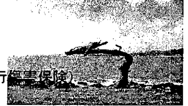
気仙沼 岩井崎【竜の松】