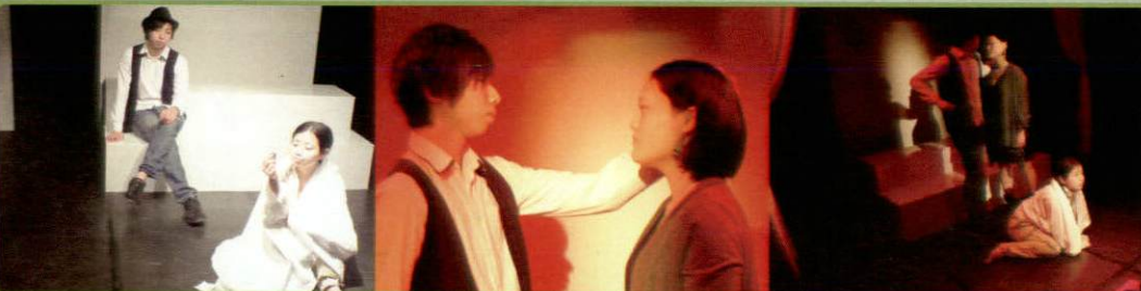
みちるCafé公演 Vol.1 2013年3月「Nowhere」クォータースタジオ