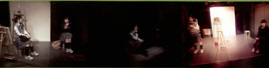
みちるCafé公演 Vol.2 2013年12月「Over The Flowers」クォータースタジオ